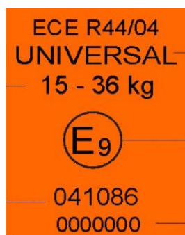
Etiqueta UN R44

El compromiso de AESVi es trabajar para que se pongan en marcha medidas concretas y eficaces que garanticen que ningún niño fallezca o sufra lesiones graves a causa de accidentes de tráfico.